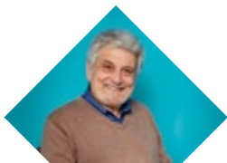
Des personnes aidées