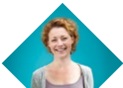
Les structures d'aide à domicile